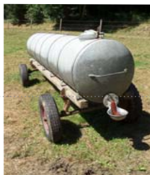
Mod. 98 Ansicht Weidefass