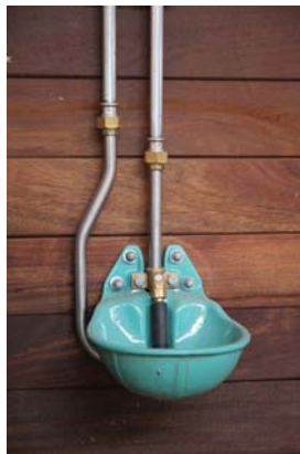
Mod. 25R / Ansicht Pferdebox mit Ringleitung