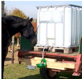
Mod. 10P - Ansicht mit Anschluss-Set IBC-Container