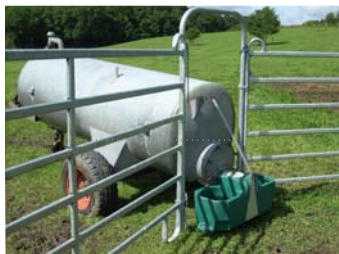
Mod. FT 80 Ansicht Weidefass