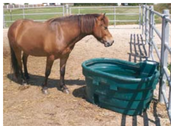
WT 600 - Pferd am Weidetrog