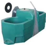
Mod. FT 80