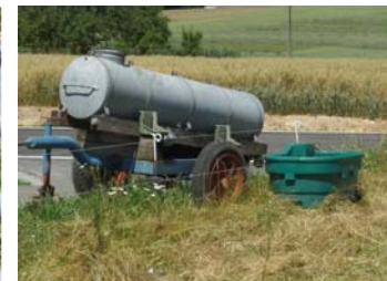
WT 400 Weidetrog - Ansicht am Wasserfass